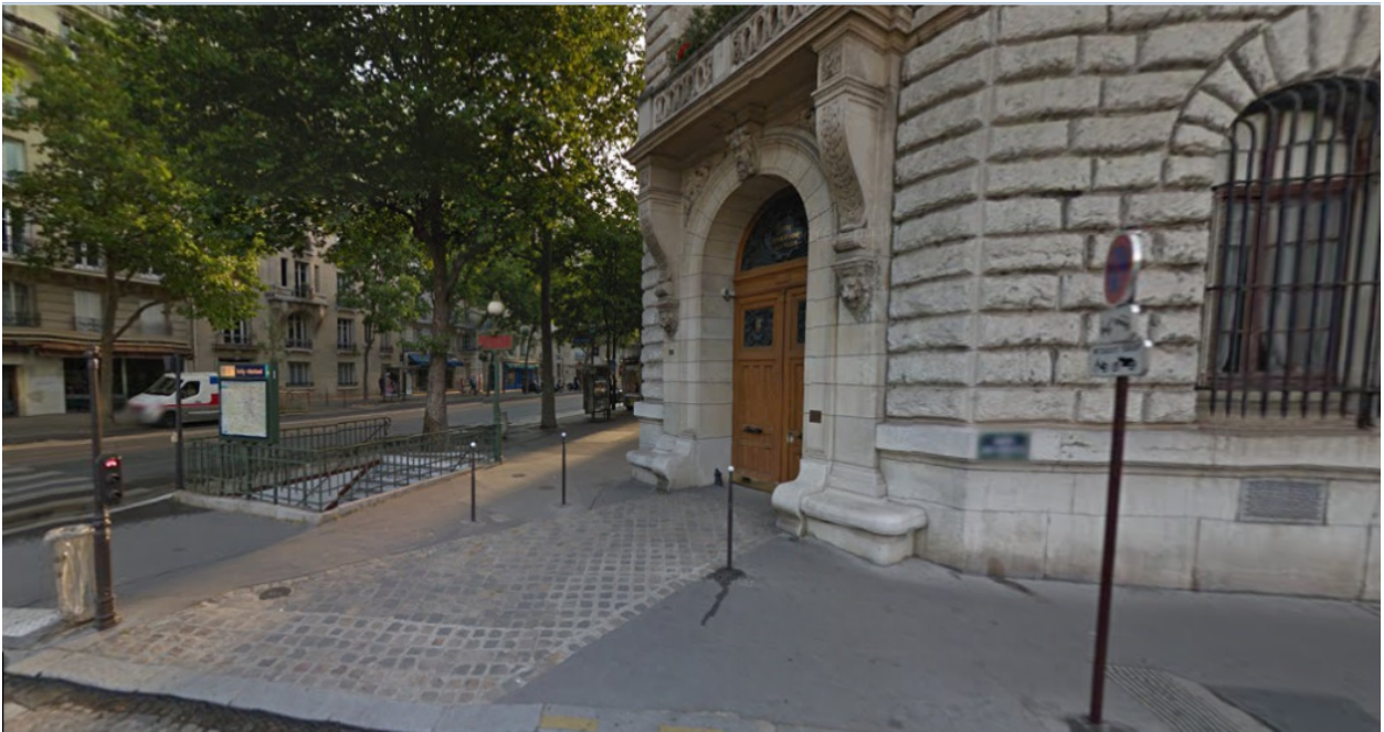
Rue de Sully, Paris

3.2. f_1: (2.2) \rightarrow \text{Ad} = f(O^1)