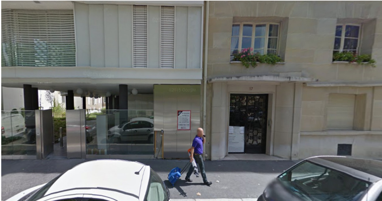
Avenue de Saxe, Paris